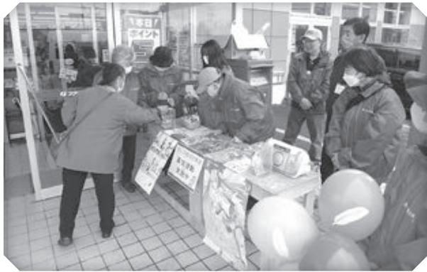
▲街頭募金活動の様子