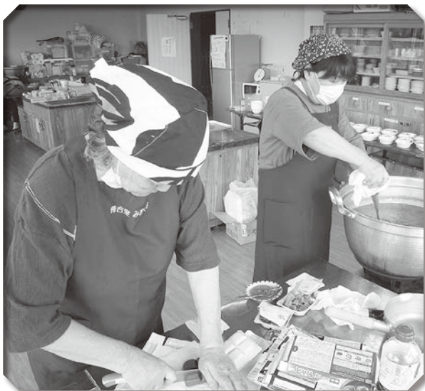
▲暑い中、カレーライスを作るスタッフたち