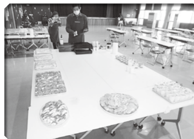
▲バイキング形式で開催