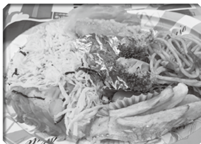
▲ちらし寿司・からあげ、ポテト・ナポリタンなど、豪華なメニュー