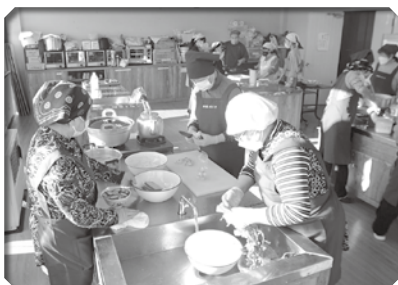
▲たくさんの料理を作る調理スタッフの皆さん

美味しいご飯を食べた後、トナカイやサンタの衣装を着た高校生と一緒に鬼ごっこや宝さがしゲームをして楽しい時間を過ごしました。