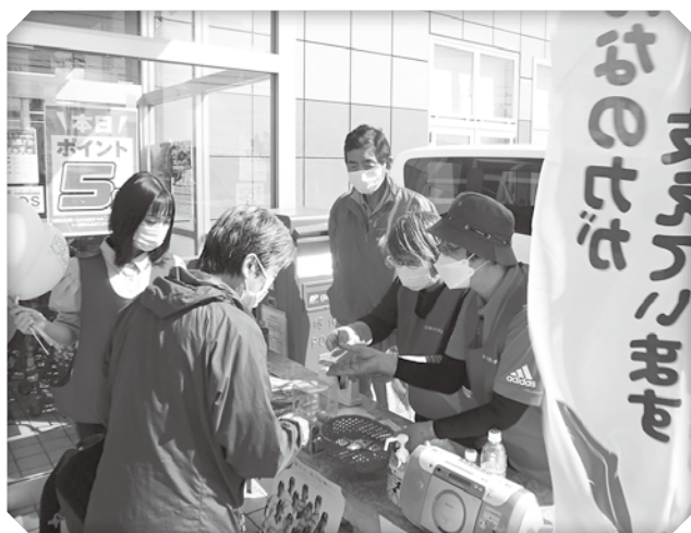
▲街頭募金活動の様子

この貴重な善意は、社会福祉協議会や弟子屈町内で活動されている地域福祉団体等の事業を支援し、誰もが安心して暮らせる福祉のまちづくりのために使わせていただきます。