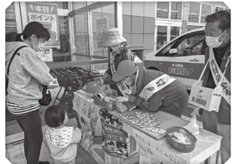
街頭啓発活動の様子

また、10月1日と2日には、共同募金委員会役職員のほか、弟子屈町の地域福祉推進のために活動している福祉団体等から、24名の方が街頭啓発に立ち、ご協力いただきました。