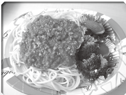
▲今回はスパゲティミートソースのお弁当