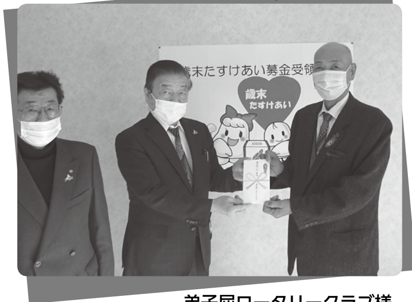
弟子屈ロータリークラブ様