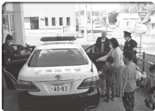
▲ワクワクしながらパトカー試乗体験中

10月に福祉センターで開催した「キッチンみちくさ」 では、弟子屈警察署の皆さんが、参加した子どもたちの ためにパトカー試乗体験を行ってくれました。参加した 子どもたちは、美味しいごはんを食べた後に普段できな い貴重な体験ができて、喜んでいました。