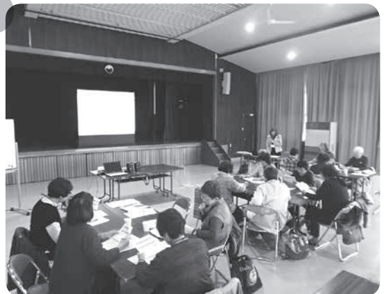
町内の防災マップづくりを行う奉仕団たち

グループワークでは、町内の防災マップを作り、「町内で災害が発生した際には何が出来るのか」や「奉仕団の活動を継続するためには何が必要か」などをお互いに話しあい、意見交換をしました。