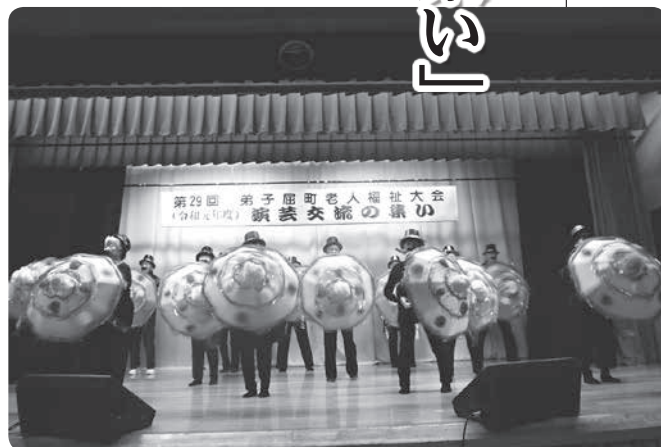
ドリフのズンドコ傘踊りを披露した 美里寿友の会有志の皆さん

どの出演、引き続き、第二部では各クラブ18組の参加者の出演を頂き、カラオケや踊り、合唱等が披露され会場は大いに盛り上がりつつありました。 作品展示には、8名の方より陶器、木彫り等、コトコツ一年間で積み重ねられた力作が展示され、訪れた方々の目を惹きつけてくれました。 それぞれ会員さんは終了とともに、熱が冷めないうちに、もう来年に向けて試案を練ることへ気持ちに移り、老人クラブ活動の活発な光景がうかがい知ることができました。