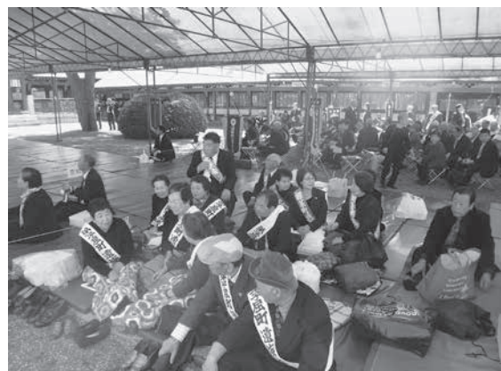
北海道護国神社慰霊大祭 ～参列の様子～

遺族会も高齢化が進んでおり、年々参加者も減ってきていますが、今後も参拝を継続して参ります。