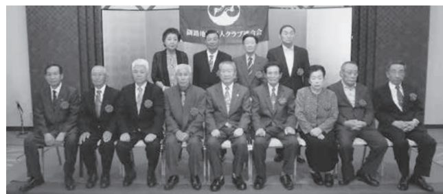
この度、授賞された皆さま

本年度総会については、平成二十八年度事業報告並びに収支決算報告、平成二十九年度事業計画（案）、収支予算（案）及び事業企画（案）の提案がなされ、全て承認されましたことをご報告いたします。