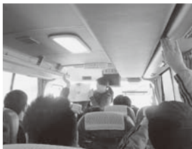
▲映画館までの移動中、子ども発達支援センターの先生方が出題するクイズに、元気よく手を挙げて答える参加者たち。

映画鑑賞が初めての人もいましたが、参加された皆さんが最後まで映画を楽しみ、冬休みの思い出になったと思います。