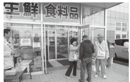
10月上旬に2日間行った街頭募金啓発活動

共同募金運動が始まって70回目となりました。10月1日からの「赤い羽根共同募金運動」と、12月1日からの「歳末たすけあい募金」は12月末をもって終了しました。