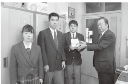
弟子屈高校生徒会今年度は、7つの学校が募金活動に協力してくれました。