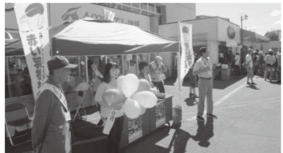
興行募金活動実施 摩周湖農業祭会場にて