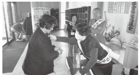
2回目の興行募金を実施 老人福祉大会会場にて