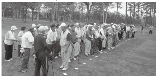
大会に参加された皆さん

毎年開催される本大会は、管内七町村老人クラブより選抜された会員一〇五名が参加され、弟老連からも予選会を勝ち抜いた男女各九名（計十八名）の会員が参加いたしました。弟老連選抜会員の方々は、惜しくも上位入賞には至りませんでした。個人賞といたしまして「とび賞」「ホールインワン賞」の各賞を次のように受賞されました。