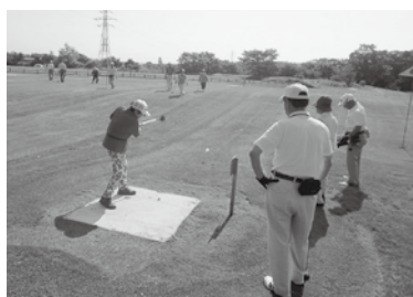
晴天の中のプレーとなった当日の様子

当大会は、釧路地区老人クラブパークゴルフ大会への出場権予選を兼ねており、当日は炎天下にもかかわらず各組白熱した展開を繰り広げておりました。