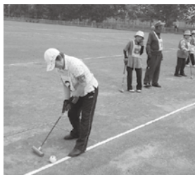
狙いを定めて打つ！

両チームも健闘虚しく、昨年度の成績を上回る結果とはならず、参加された方々は次年度こそリベンジを果たしたいと意気込みを語っておりました。