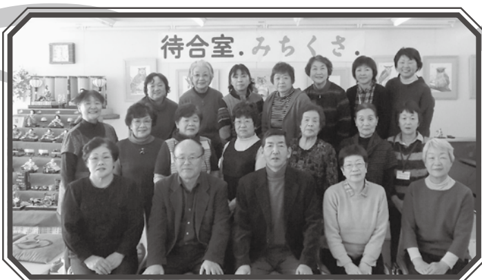
▲みちくさサロンに参加した皆で最後に記念撮影

去る2月19日(金)、10時から待合室みちくさにて、「みちくさスタッフを対象にしたサロン」を開催しました。